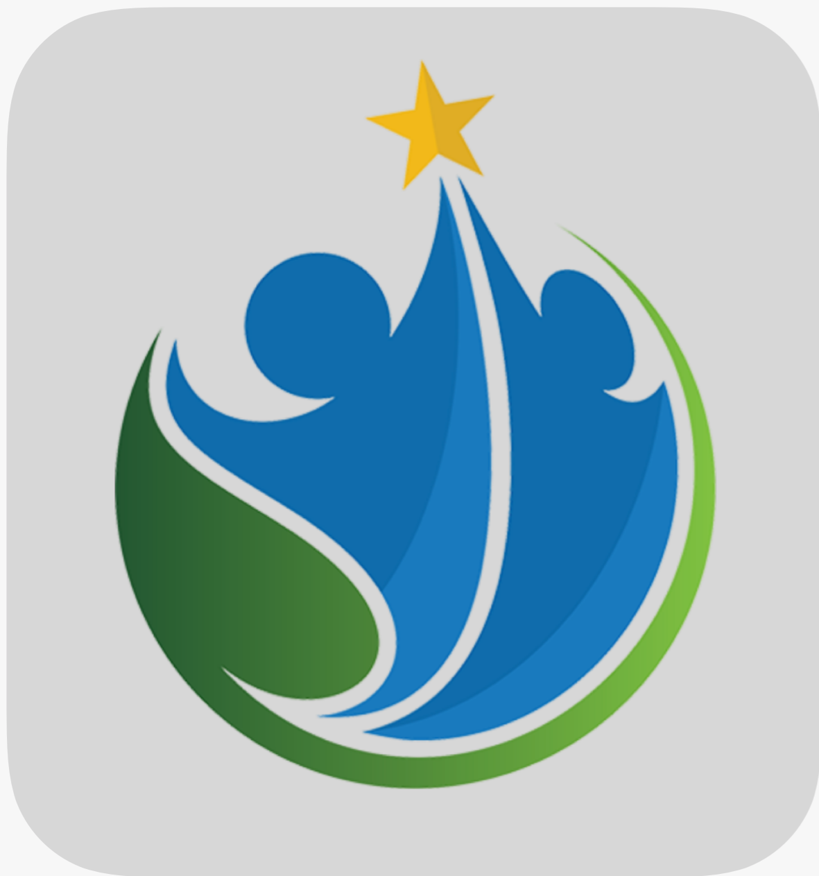
LOGOTYP ROZGRYWEK DZIECI ZZPN