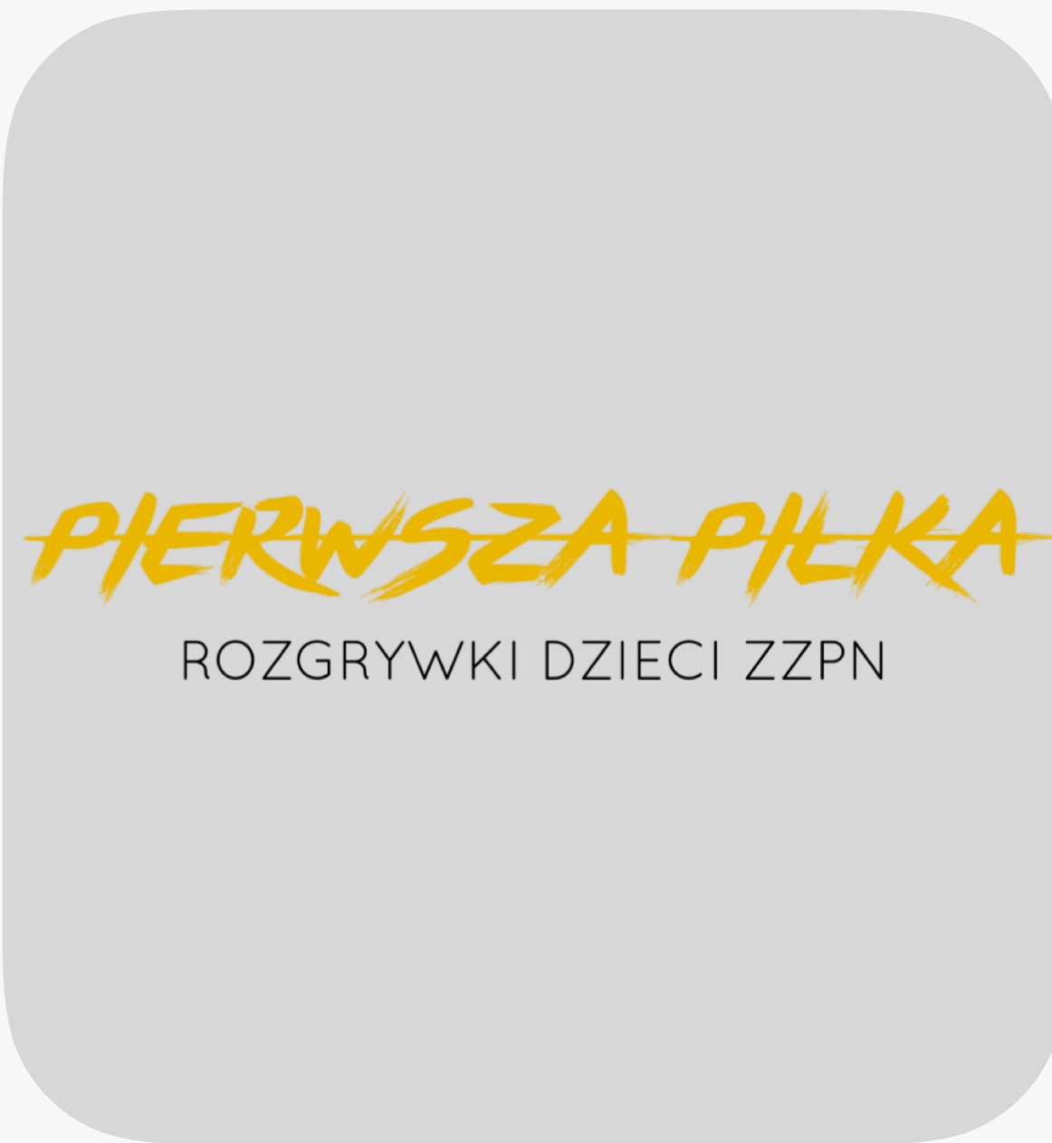
NAZWA ROZGRYWEK DZIECI ZZPN